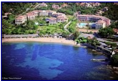
Résidence Pierre & Vacances

Tennis, golf et diverses activités nautiques sont proposées à proximité des deux établissements. Enfin, prenez le temps de découvrir les paysages somptueux aux alentours et notamment les magnifiques calanques entre la pointe de la Calle et la pointe des Issambres. Enfin, la proximité de villes festives telles que St-Tropez ou Ste-Maxime permet de profiter de nombreuses distractions le jour comme la nuit.