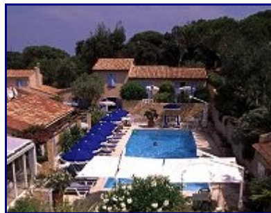
Hôtel Le Jas Neuf